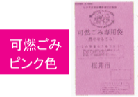
可燃ごみ ピンク色